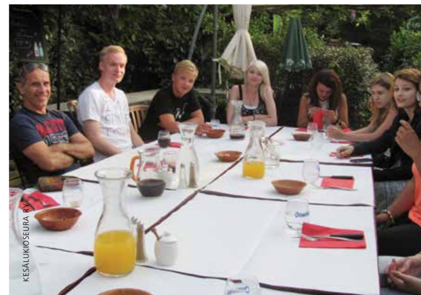
▲ Levollinen ilmapiiri ruokkii kielen harjoittelua.

< Kielitaidon avulla voi valloittaa maailman.